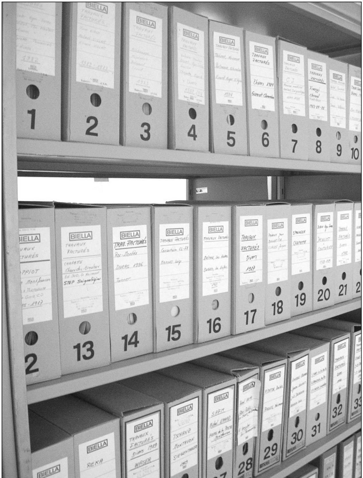
Les multiples dossiers de l'un des fonds déposés en 2007 au CEJARE, les archives de l'entreprise de construction Todeschini & Locatelli SA à Saignelégier.