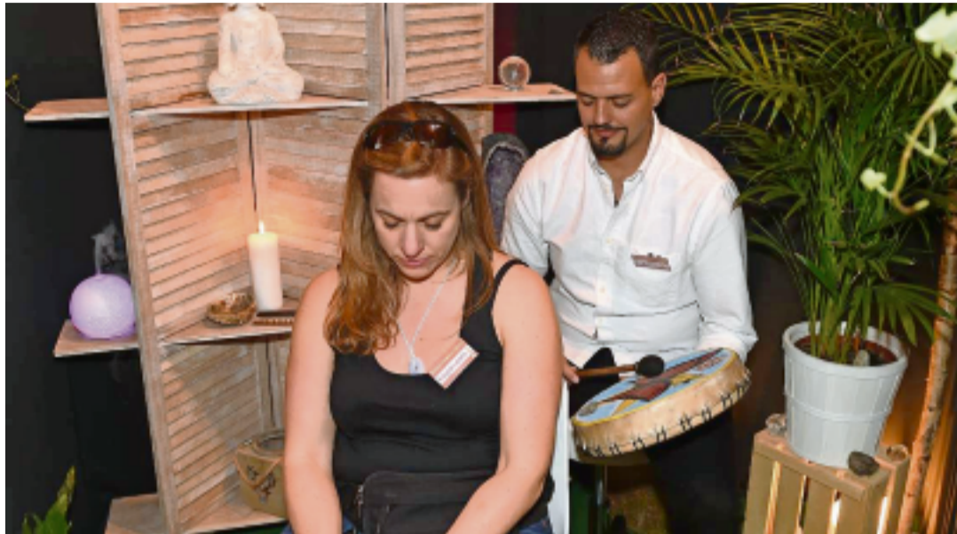
Saignelégier a son salon du mieux-vivre, Loveresse celui du bien-être.

«C'est en discutant avec des connaissances qui sont elles-mêmes thérapeutes que nous avons jugé qu'il serait intéressant de mieux faire connaître ce qui existe dans ce domaine dans la région, explique-t-il. Moi-même, je ne suis pas thérapeute mais je m'intéresse à tout ce qui est médecines naturelles. Je trouve qu'elles peuvent être un bon complément à la médecine traditionnelle. Cette dernière a certes apporté beaucoup et demeure essentielle. Mais elle a aussi fait oublier des remèdes plus naturels, qui ressurgissent peu à peu. Il n'y a rien de magique là-dedans. Je pense qu'on redécouvre simplement au-