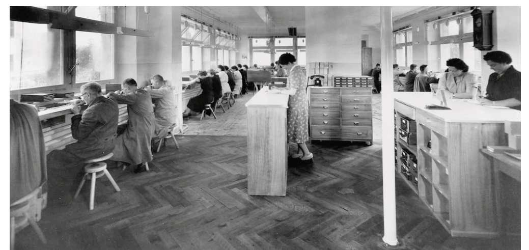
Les fonds du CEJARE ne comportent pas uniquement des textes; ils contiennent également des photographies, des plans, des affiches qui permettent de donner un visage au travail quotidien tel que le connaissaient les générations passées.

FINANCEMENT Le budget du CEJARE dépend autant des fonds qui lui sont alloués par le canton que du travail que le centre réalise auprès des différentes entreprises qui mandatent ses services. «On fait appel à nous pour plusieurs de nos compétences. D'abord, pour réaliser des travaux de recherche sur l'entreprise ou sur ses fondateurs, pour collecter des informations sur un aspect précis de son passé ou afin de rédiger des brochures qui retracent son parcours. On nous contacte, ensuite, pour notre savoir-faire en terme de classement: en se rendant auprès d'une entreprise pour organiser ses archives, on fait en sorte que celles-ci résistent efficacement au temps, prennent le moins de place possible et soient aisément consultables», explique encore le nouveau responsable du CEJARE. ◉ AVU