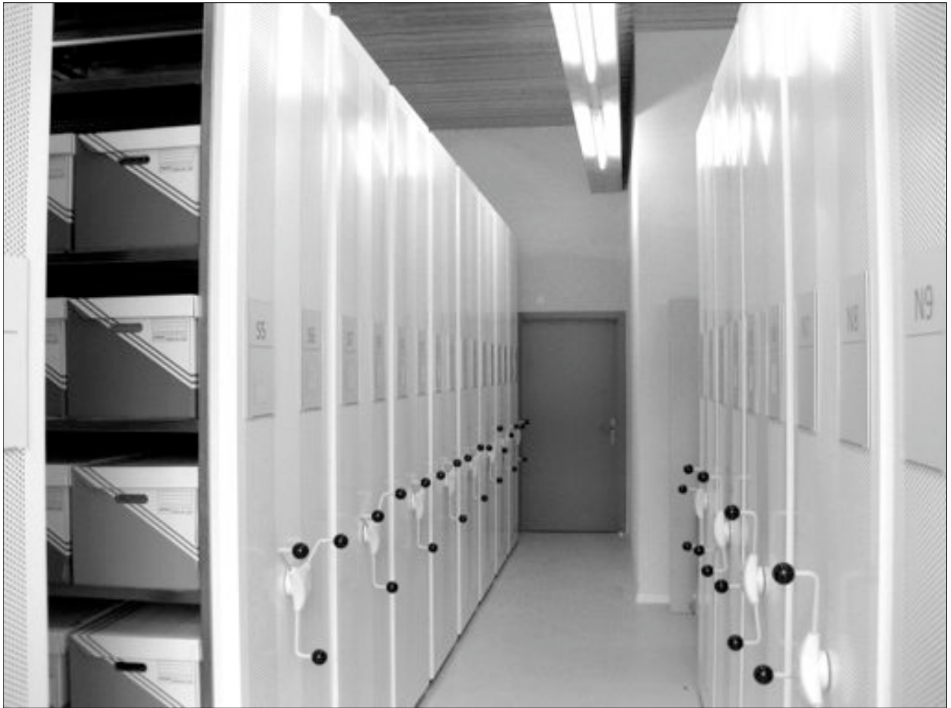
Une vue du nouveau dépôt d'archives du CEJARE, installé au début de 2011.

CEJARE Centre jurassien d'archives et de recherches économiques Rue du Midi 6, 2610 Saint-Imier tél. 032 941 55 45 cejare@cejare.ch www.cejare.ch