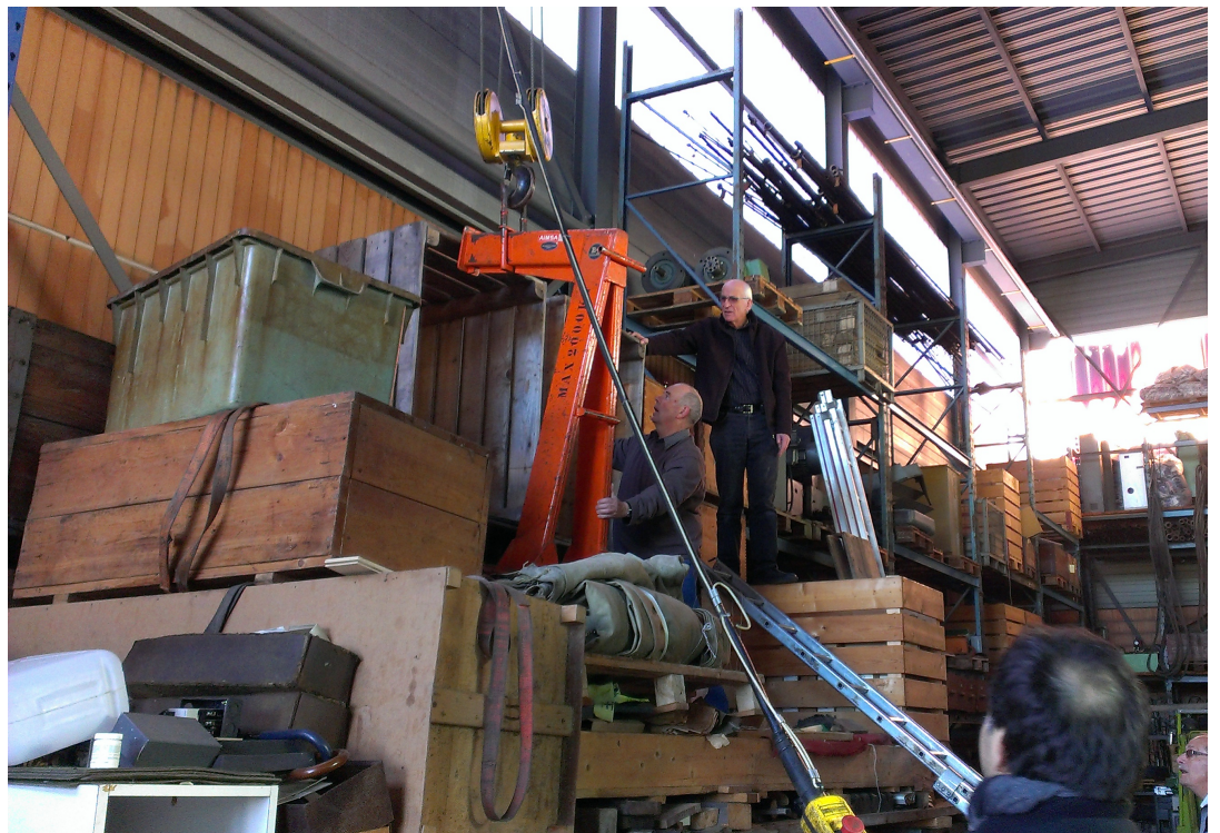
20 mars 2014 : récupération de caisses d'archives de le TMCo à Grandval.

En fin d'année 2013, le Musée du Tour automatique et d'histoire de Moutier, par MM. Stéphane Froidevaux et Eric Moos, avait contacté le CEJARE à propos des archives de la Tavannes Machines Co (TMCo) conservées chez Wisard Frères à Grandval et sur la possibilité de leur conservation au CEJARE. Cette collaboration fructueuse entre institutions a abouti en 2014 et a été relaté par la presse lors de la conférence de presse organisée par le Musée du Tour automatique à Moutier le 15 septembre. L'opération de rapatriement des archives TMCo a beaucoup mobilisé nos forces de janvier à mai et a nécessité l'engagement de personnel auxiliaire tant le volume d'archives récupérées est important. Outre la documentation déjà riche récupérée dans les bureaux de WFG, nous avons encore rapatrié 11 caisses d'archives en bois de plus de 200 kg et une palette CFF de documents TMCo. La dernière palette et demi sera rapatriée en avril 2015.